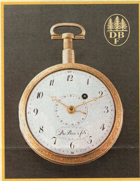
Original Du Bois-Uhr aus dem Jahre 1798 mit Datumsanzeige aus dem Zentrum und Repetiermechanismus.

Das frühe Meisterwerk aus dem Hause Du Bois & Fils befindet sich heute im Besitz des „Musée d'Horlogerie Château des Monts“ in Le Locle, Suisse.